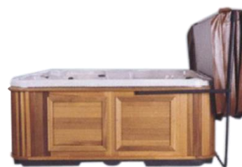
con sollevatore di copertura with cover lifter